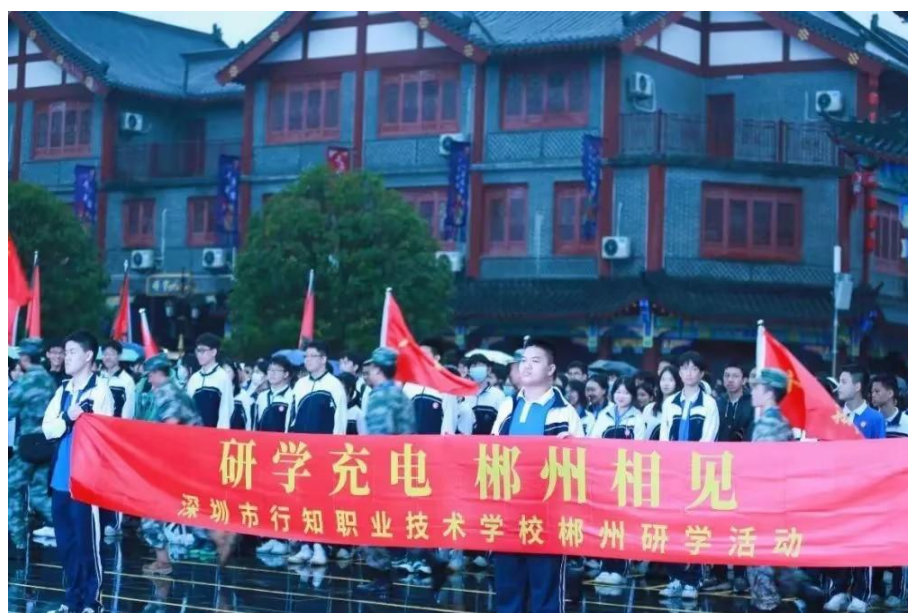
湖南郴州研学活动