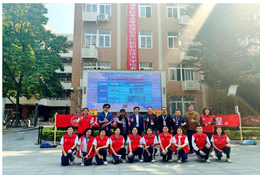
广州美术学院深圳校考学生志愿者活动

深深刻在学生心里。青年在参与志愿服务的同时也提升了自身的精神素养与实践能力，达到了“助人”和“育己”的双赢。